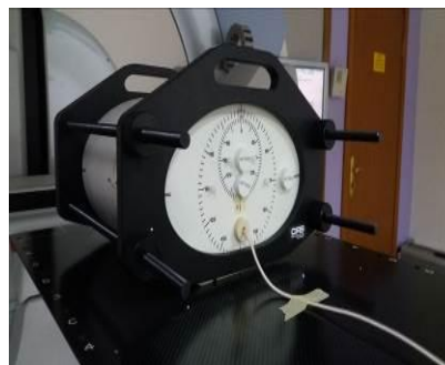
Gambar 1. Pengukuran pada fantom homogen

Kalibrasi dilakukan pada dosimetri TLD dan Film Gafchromic EBT3. Kalibrasi TLD dilakukan untuk mendapatkan hubungan nilai bacaan TLD dengan nilai dosis. Kalibrasi film gafchromic EBT3 dilakukan untuk menentukan hubungan antara dosis dengan bacaan nilai piksel film. Baik kalibrasi TLD maupun film gafchromic EBT3 dilakukan menggunakan dua nilai rentang dosis, yakni dosis rendah yang rentang dosisnya dari 10-500 cGy dan dosis tinggi yang rentang dosisnya dari 500-1800cGy dan menggunakan solid water phantom yang dipapar dengan energi foton 6 MV, menggunakan teknik SSD 100 cm, luas lapangan 10 x 10 cm 2 , dan kedalaman (z) 5 cm. Hanya TLD yang sensitivitasnya memiliki standar deviasi ±3% yang digunakan pada setiap kelompok TLD yang terdiri dari 3 buah rod TLD.