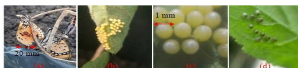
Gambar 1. Morfologi telur A. terpsicore