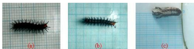
Gambar 3. (a) larva instar 4, (b) larva instar 5, dan (c) pupa.

Berdasarkan hasil penelitian yang telah dilakukan, bahwa lama hidup masing-masing stadia A. terpsicore pada tanaman inang P. racemosa memiliki lama perkembangan yang berbeda-beda. Lama hidup pada stadia pradewasa yang paling cepat yakni pada stadia telur, sedangkan yang paling lama pada stadia larva instar 5. Total perkembangan lama hidup kupu-kupu A. terpsicore dari telur sampai ke imago berlangsung selama 34 – 44 hari dengan rata-rata 38,12 \pm 2,34 hari, pada suhu 25,97 - 29,68 °C dan kelembaban 75 – 83%. Lebih lama dibandingkan, pada penelitian Dahelmi et al. (2014), lama hidup A. violae dari stadia telur hingga imago pada tanaman P. foetida berkisar antara 23 - 28 hari dengan rata-rata 25,60 \pm 1,14 hari, pada suhu 27,9 - 30,8 °C dan kelembaban 64,0 – 69,4%.